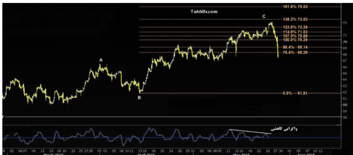
نمودار روند تغییرات تایم فریم روزانه قیمت نفت خام سبک آمریکا