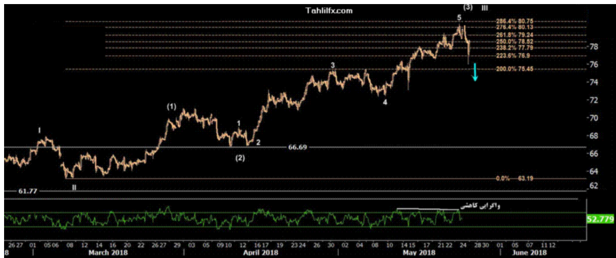
نمودار روند تغییرات تایم فریم روزانه قیمت نفت برنت دریای شمال