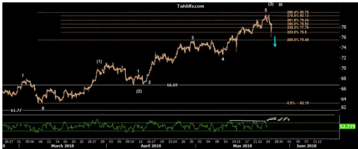
نمودار روند تغییرات تایم فریم روزانه قیمت نفت برنت دریای شمال