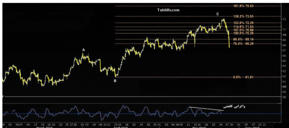
نمودار روند تغییرات تایم فریم روزانه قیمت نفت خام سبک آمریکا