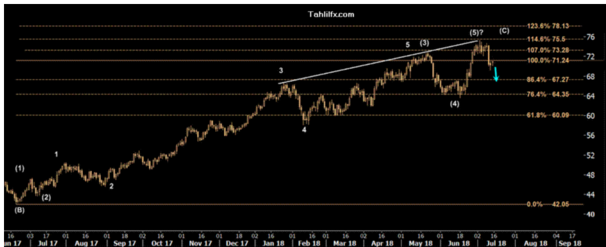
نمودار روند تغییرات تایم فریم ۱ ساعته قیمت نفت برنت دریای شمال لندن