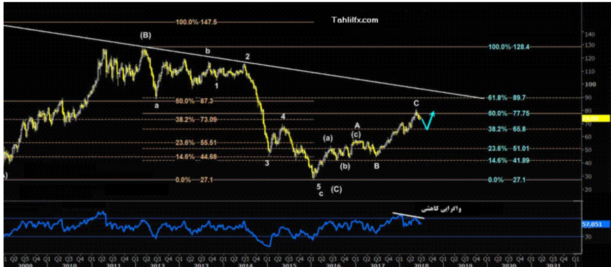
نمودار روند تغییرات تایم فریم هفتگی قیمت نفت برنت دریای شمال لندن