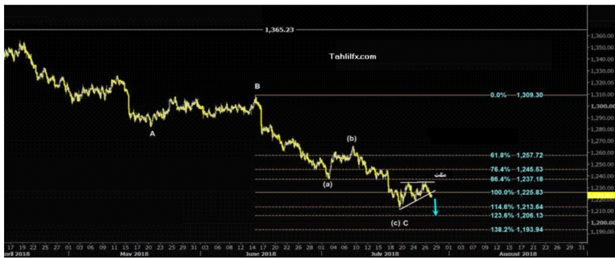
نمودار روند تغییرات تایم فریم ۱ ساعته قیمت جهانی اونس طلا