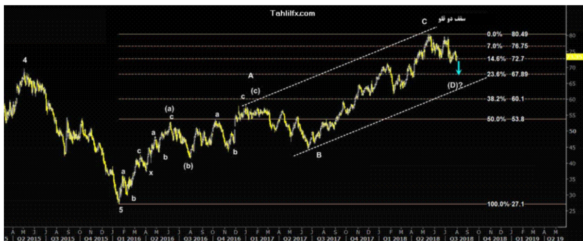
نمودار روند تغییرات تایم فریم هفتگی قیمت نفت برنت دریای شمال لندن