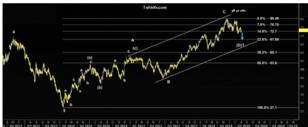
نمودار روند تغییرات تایم فریم هفتگی قیمت نفت برنت دریای شمال لندن