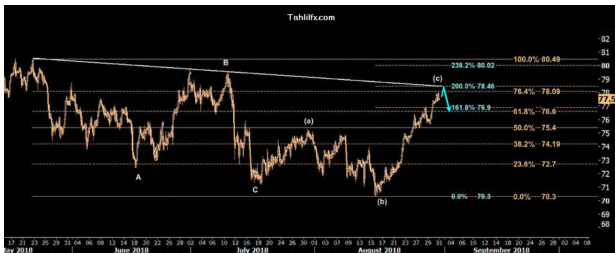
نمودار روند تغییرات تایم فریم روزانه قیمت نفت برنت دریای شمال لندن