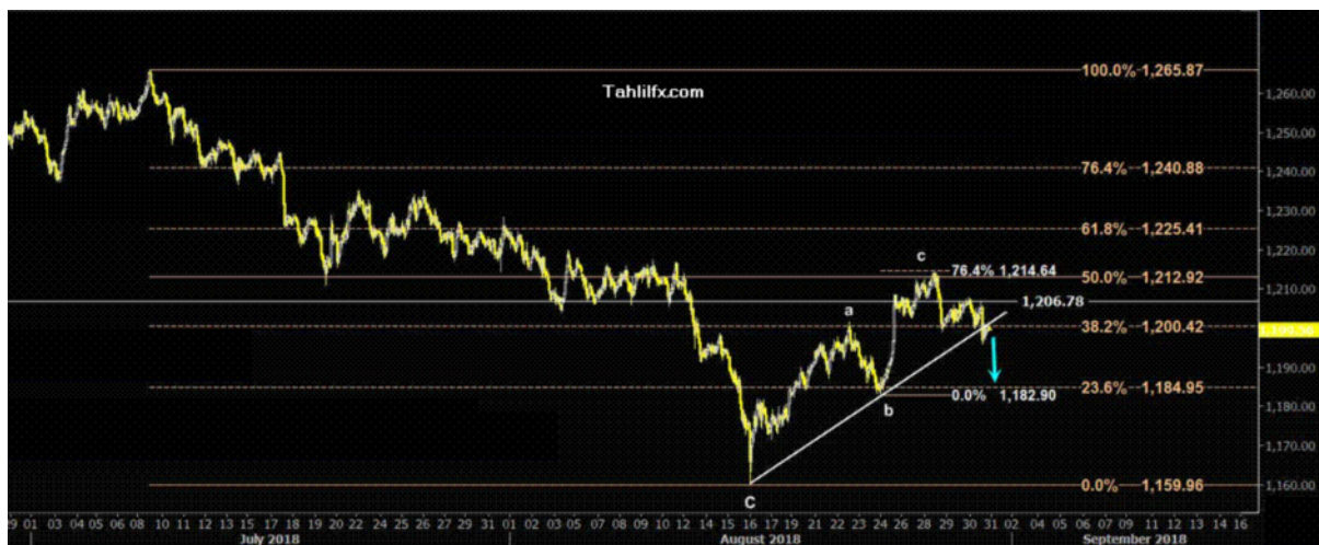
نمودار روند تغییرات تایم فریم روزانه قیمت جهانی اونس طلا