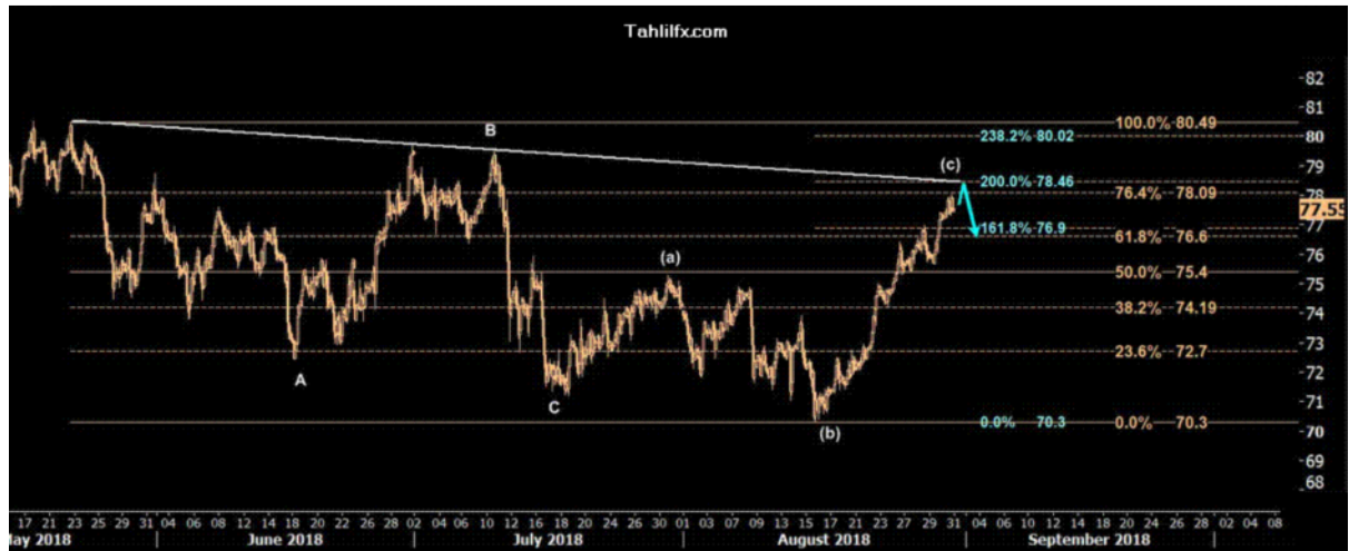
نمودار روند تغییرات تایم فریم روزانه قیمت نفت برنت دریای شمال لندن