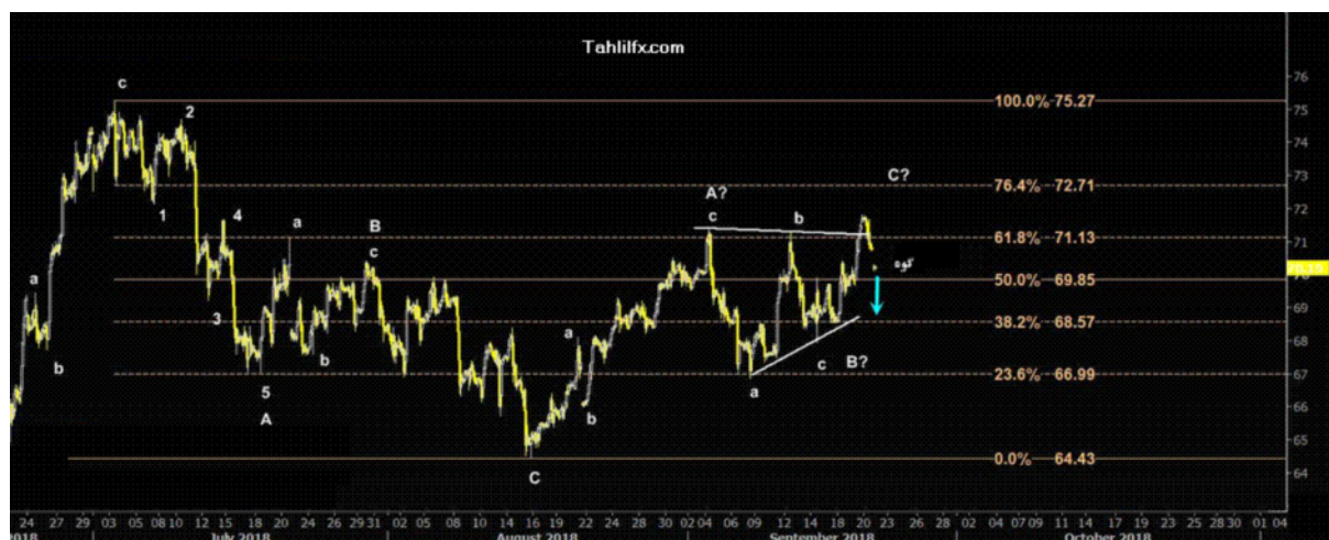
نمودار روند تغییرات تایم فریم روزانه قیمت نفت خام سبک آمریکا