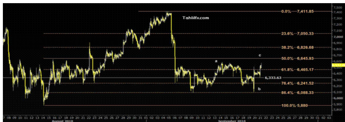
نمودار روند تغییرات تایم فریم روزانه قیمت جهانی شاخص دلار آمریکا