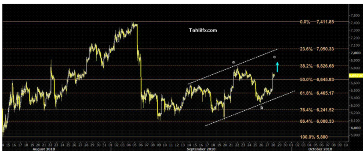
نمودار روند تغییرات تایم فریم روزانه قیمت جهانی شاخص دلار آمریکا