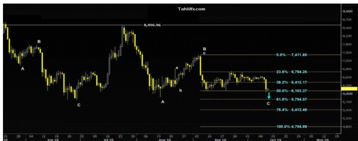
نمودار روند تغییرات تایم فریم روزانه قیمت جهانی شاخص دلار آمریکا