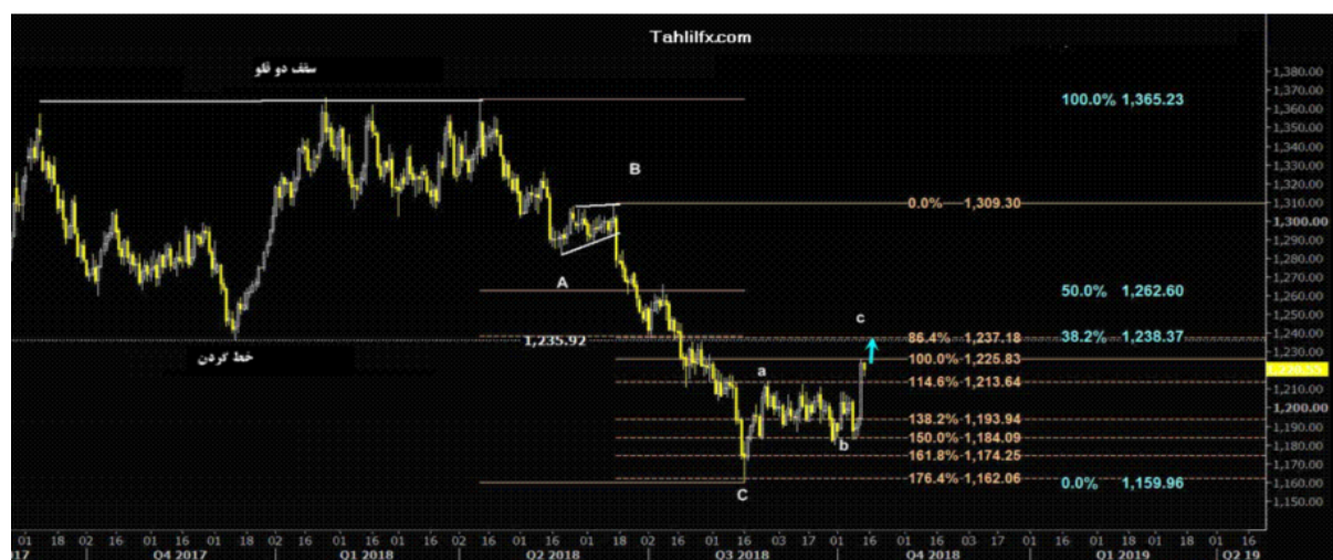
نمودار روند تغییرات تایم فریم روزانه قیمت جهانی اونس طلا

این هفته در تقویم اقتصادی آمریکا خبر خاصی منتشر نخواهد شد اما در طول این هفته آمارهای خرده فروشی، مجوز ساختمان سازی و شروع خانه سازی و فروش خانه های موجود آمریکا اعلام می شوند و با توجه به انتشار صورتجلسه بانک مرکزی آمریکا در روز چهارشنبه بحث های مربوطه در خصوص چشم انداز نرخ بهره بانک مرکزی آمریکا اهمیت خاصی دارد و بسته به اینکه در درون این جعبه چه باشد قیمت جهانی اونس طلا نیز واکنش نشان خواهد داد. بطور معمول تقریباً بیست روز پس از نشست، صورتجلسه این نهاد اعلام می شود که در بعضی مقاطع اهمیت آن از بیانیه صادر شده پس از جلسه بیشتر است. بازار بسیار علاقه مند است تا بدانند در این جلسه چه رفته است. چه مباحثی مطرح شده؟ شرکت کنندگان چه کسانی بودند و آرای اعضای این نهاد در خصوص نرخ بهره چگونه بوده است؟ روشن شدن این سوالات می تواند از نظر تحلیل بنیادی روند قیمت جهانی اونس طلا را بعد از انتشار صورتجلسه بانک مرکزی آمریکا (FOMC) تا حدود زیادی مشخص کند.