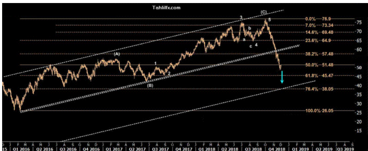
نمودار روند تغییرات تایم فریم روزانه قیمت نفت برنت دریای شمال لندن