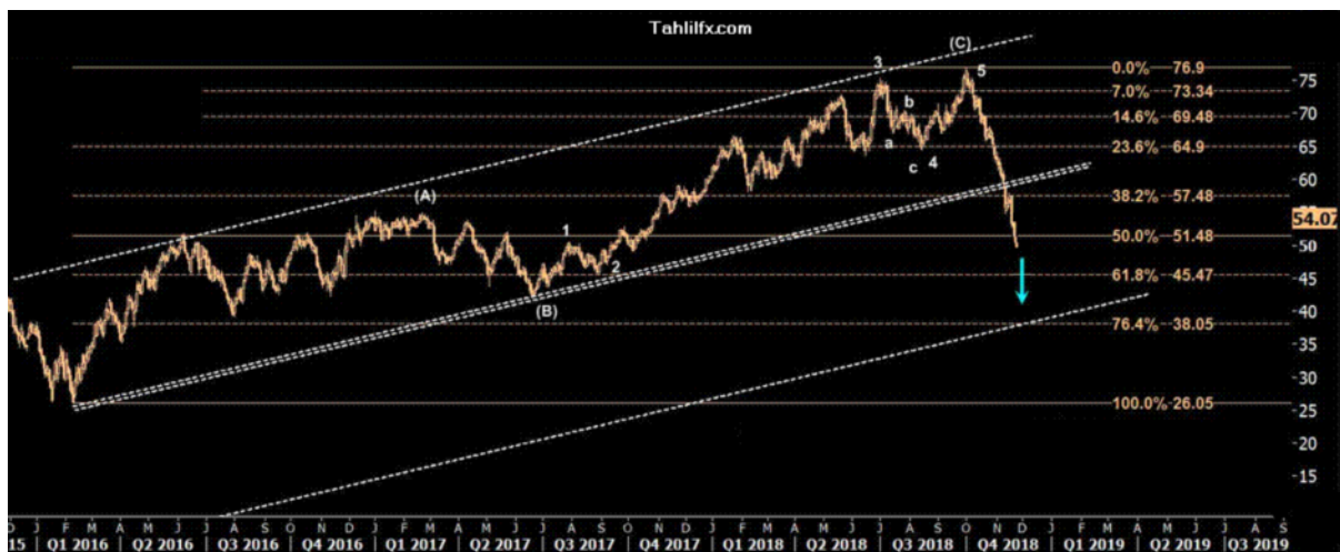
نمودار روند تغییرات تایم فریم روزانه قیمت نفت برنت دریای شمال لندن