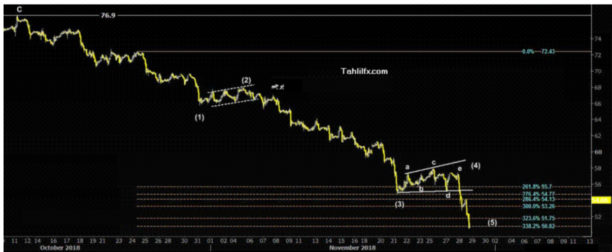
نمودار روند تغییرات تایم فریم روزانه قیمت نفت خام سبک آمریکا