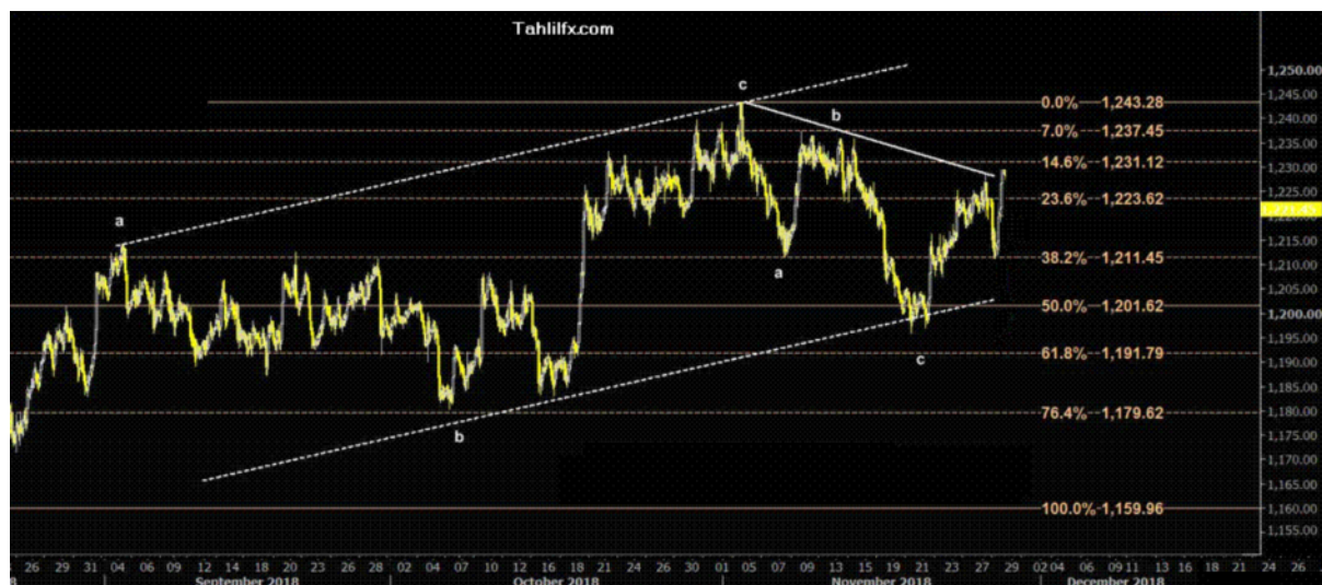
نمودار روند تغییرات تایم فریم روزانه قیمت جهانی اونس طلا