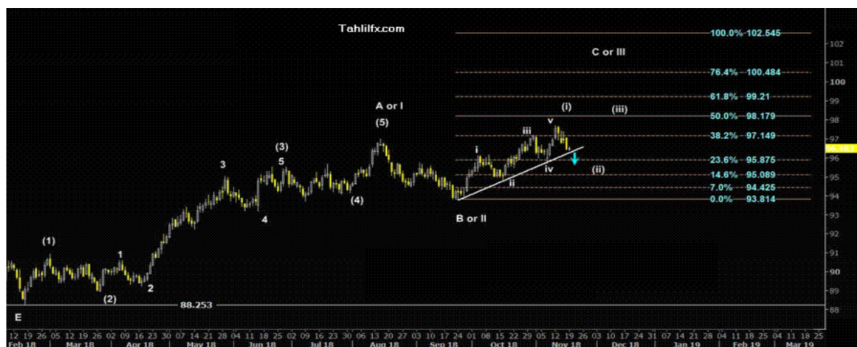
نمودار روند تغییرات تایم فریم روزانه قیمت جهانی شاخص دلار آمریکا

باید توجه داشت واحدهای پولی که در شاخص دلار آمریکا وجود دارند عبارتند از یورو ۵۷.۶٪، ین ژاپن ۱۳.۶٪، پوند انگلیس ۱۱.۹٪، دلار کانادا ۹.۱٪، کرون سوئد ۴.۲٪ و فرانک سوئیس ۳.۶٪. این شاخص یکی از مهم ترین شاخص های بازار در جهت گیری روند قیمت محسوب می شود. بطوری که هر موقع این شاخص حرکت نزولی به خود بگیرد، ارزهای سایر کشورها در مقابل دلار آمریکا تقویت شده و خریداری می شوند و هر موقع این شاخص روند صعودی داشته باشد، ارزهای سایر کشورها در مقابل دلار آمریکا تضعیف شده و فروخته می شوند. از این رو ارزهای سایر کشورها وابستگی شدید به شاخص جهانی دلار آمریکا دارند. از منظر تحلیل بنیادی قیمت جهانی شاخص دلار آمریکا رو به کاهش است و این موضوع بیشتر به خاطر چشم انداز ضعیف نرخ بهره بانک فدرال رزرو آمریکا برای سال آینده و نگرانی ها از کاهش رشد اقتصادی این کشور و خروج سرمایه گذاران از بازار سهام آمریکا است. قیمت جهانی شاخص دلار آمریکا، نوسانات بازار سهام را همیشه دنبال می کند و زمانی که بازارهای سهام بین الملل با ثبات نیستند قیمت جهانی شاخص دلار آمریکا با کاهش مواجه می شود که در چارت پایین مشاهده می فرمائید.