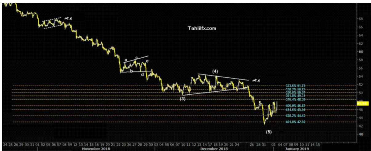
نمودار روند تغییرات تایم فریم روزانه قیمت نفت خام سبک آمریکا