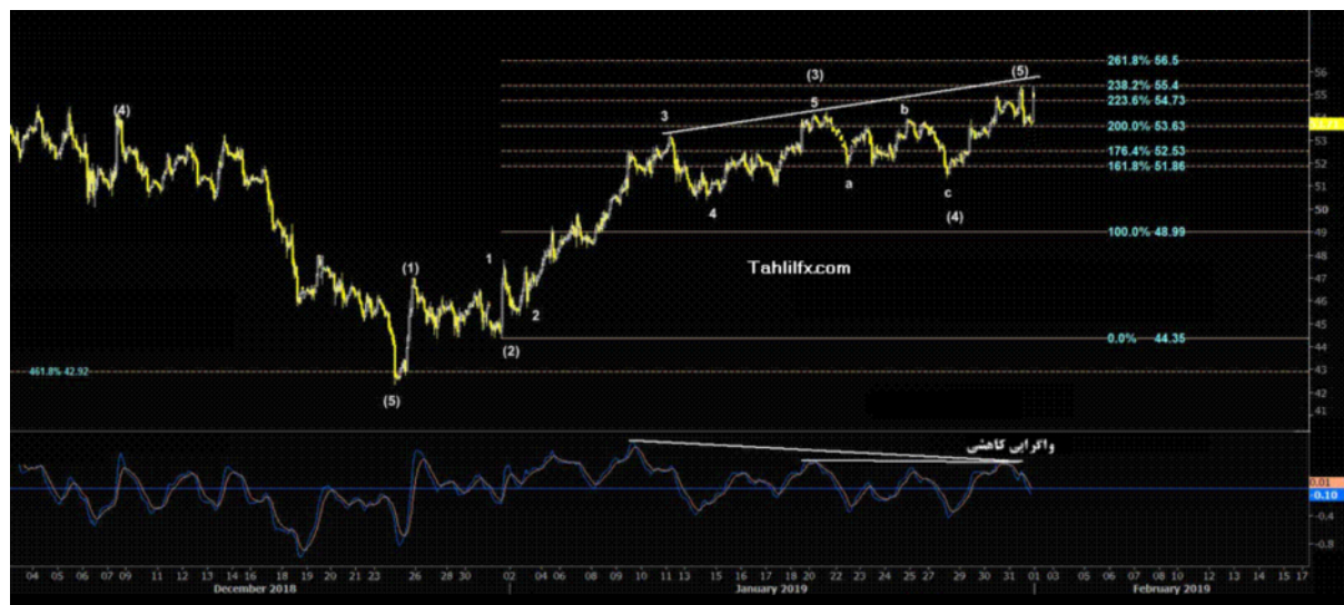
نمودار روند تغییرات تایم فریم روزانه قیمت نفت خام سبک آمریکا