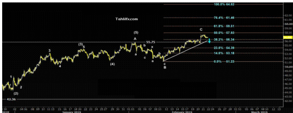
نمودار روند تغییرات تایم فریم روزانه قیمت نفت خام سبک آمریکا