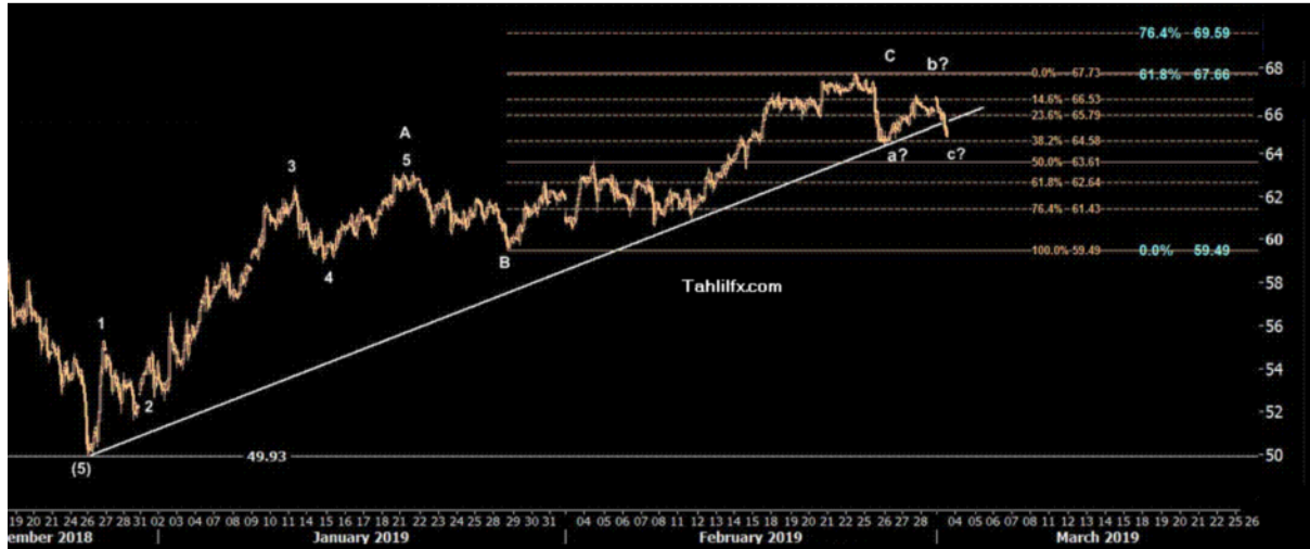
نمودار روند تغییرات تایم فریم روزانه قیمت نفت برنت دریای شمال لندن