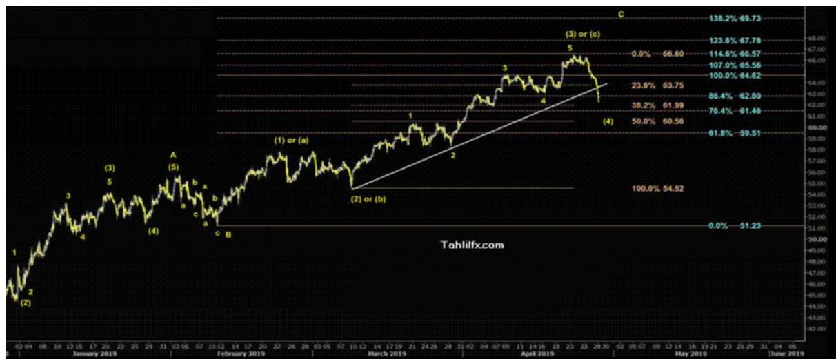
نمودار روند تغییرات تایم فریم ۱ ساعته قیمت نفت برنت دریای شمال لندن