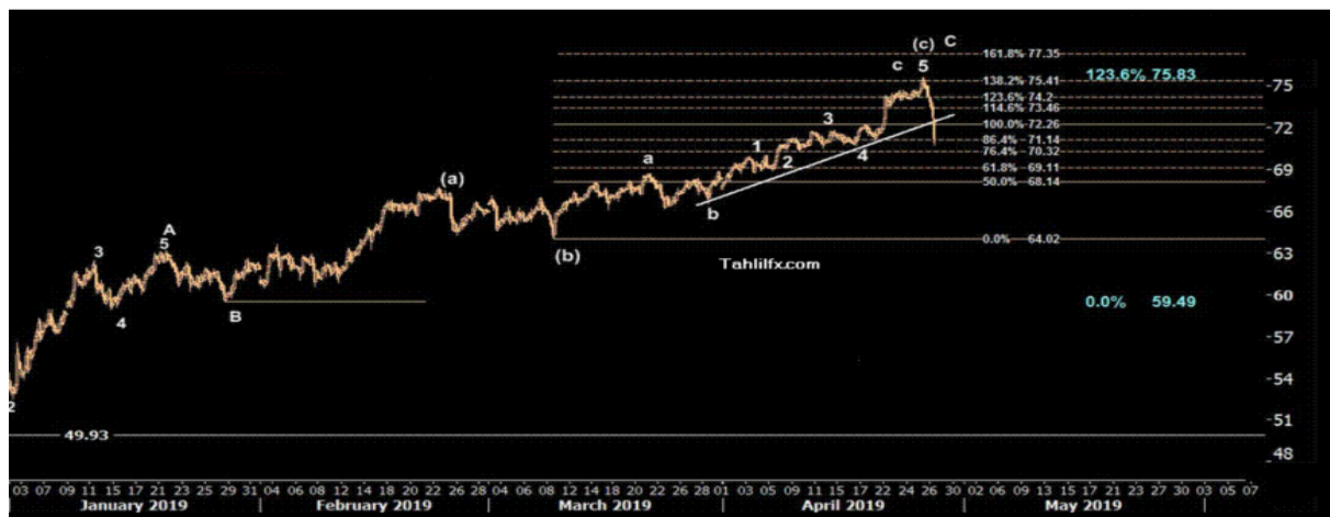
نمودار روند تغییرات تایم فریم روزانه قیمت نفت برنت دریای شمال لندن