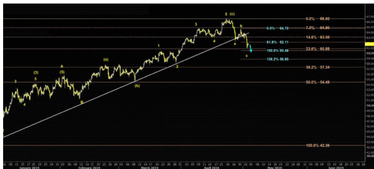
نمودار روند تغییرات تایم فریم ۱ ساعته قیمت نفت خام سبک آمریکا

باید توجه داشت آمارهای اداره اطلاعات انرژی نشان می دهد که میزان صادرات نفت این کشور امسال برای اولین بار از مرز ۳ میلیون بشکه عبور کرده است و بهبود زیرساخت های صادرات، عرضه نفت آمریکا به بازارهای جهانی افزایش بیشتری خواهد داشت که همین مساله باعث تضعیف قیمت نفت خام سبک آمریکا و برنت دریای شمال در بازار شده است.