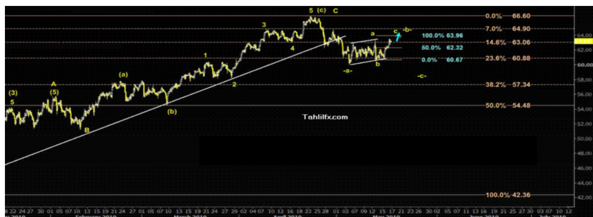
نمودار روند تغییرات تایم فریم روزانه قیمت نفت خام سبک آمریکا