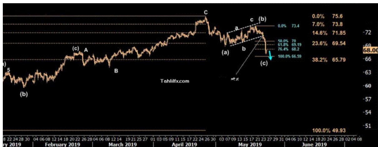
نمودار روند تغییرات تایم فریم روزانه قیمت نفت برنت دریای شمال لندن