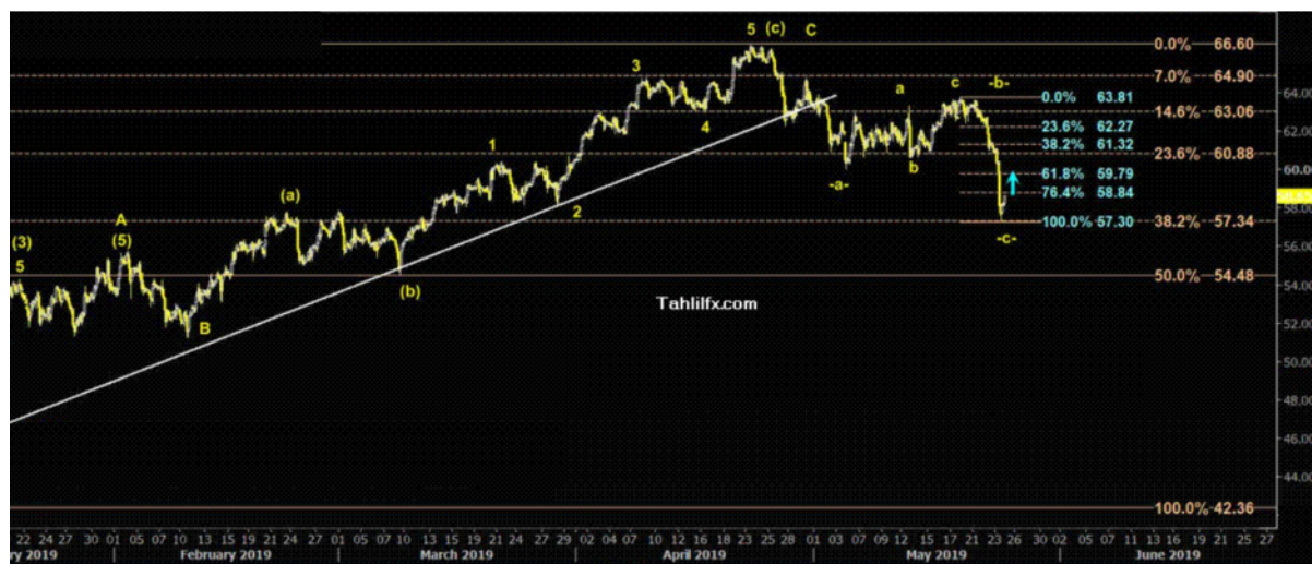
نمودار روند تغییرات تایم فریم روزانه قیمت نفت خام سبک آمریکا