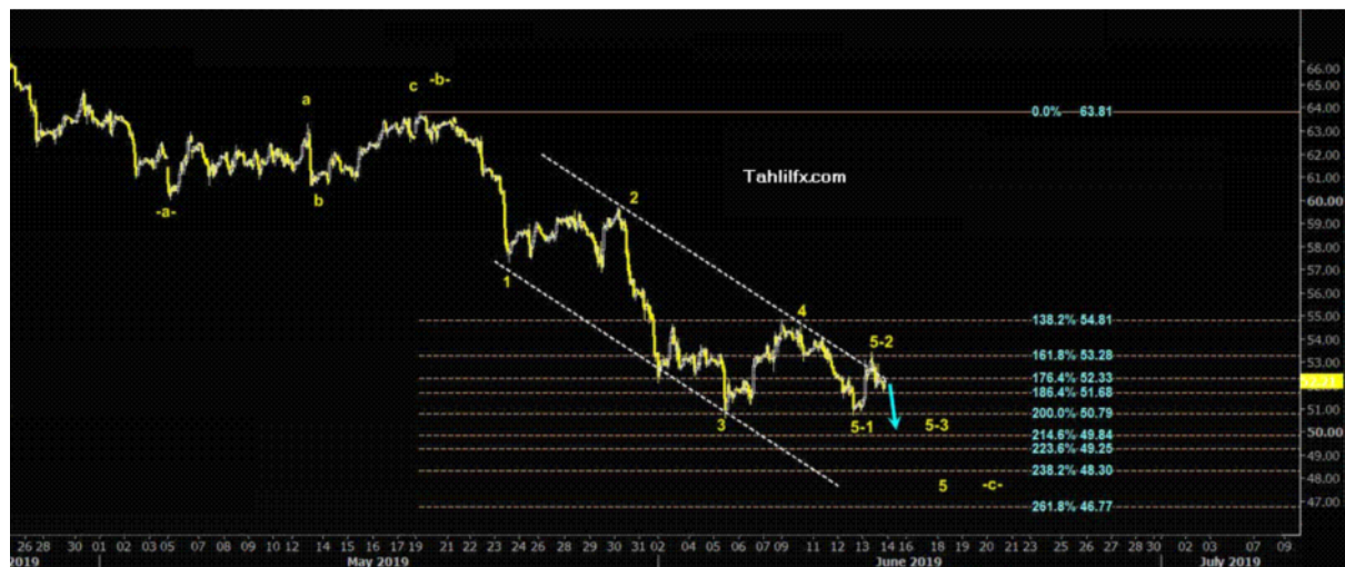
نمودار روند تغییرات تایم فریم روزانه قیمت نفت خام سبک آمریکا