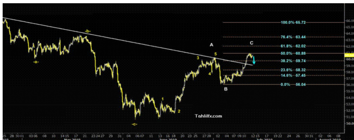
نمودار روند تغییرات تایم فریم روزانه قیمت نفت خام سبک آمریکا