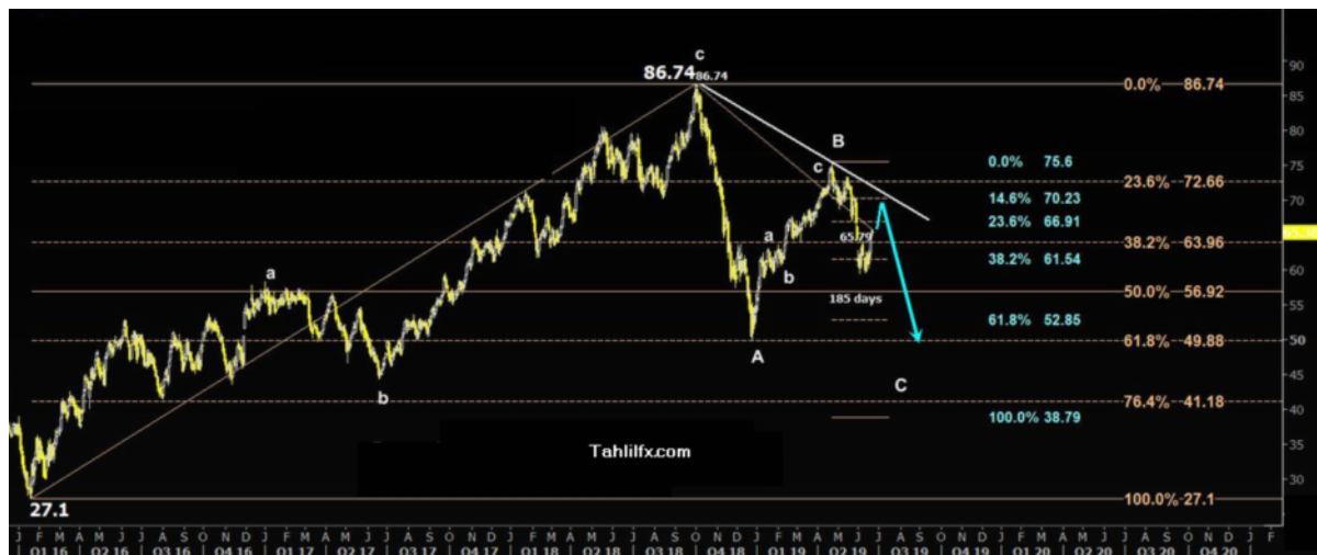
نمودار روند تغییرات تایم فریم هفتگی قیمت نفت برنت دریای شمال لندن