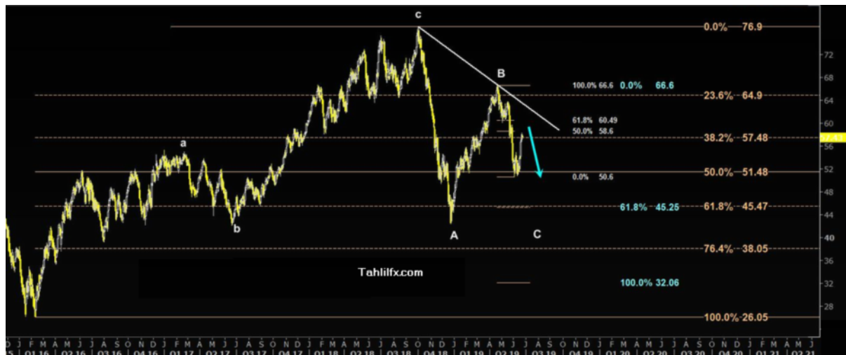
نمودار روند تغییرات تایم فریم ماهیانه قیمت نفت خام سبک آمریکا