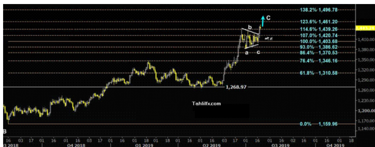
نمودار روند تغییرات تایم فریم هفتگی قیمت جهانی اونس طلا