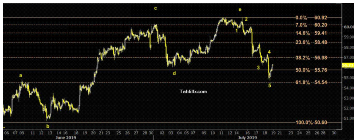
نمودار روند تغییرات تایم فریم ۱ ساعته قیمت نفت برنت دریای شمال لندن