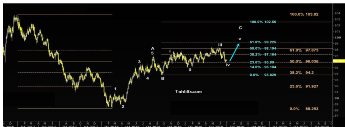
نمودار روند تغییرات تایم فریم روزانه قیمت جهانی شاخص دلار آمریکا