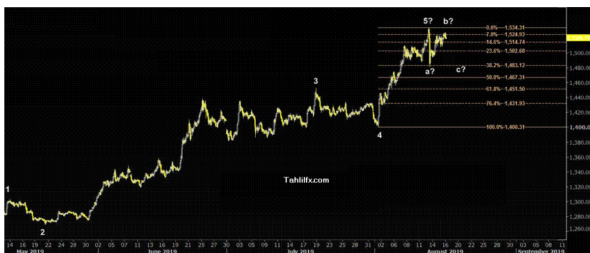
نمودار روند تغییرات تایم فریم روزانه قیمت جهانی اونس طلا