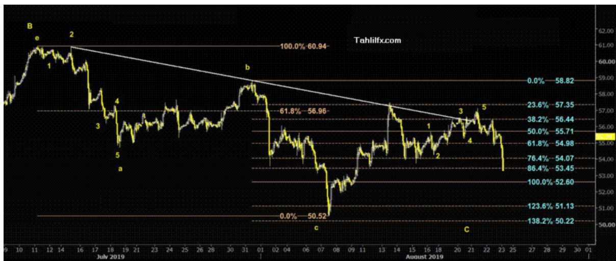
نمودار روند تغییرات تایم فریم روزانه قیمت نفت خام سبک آمریکا