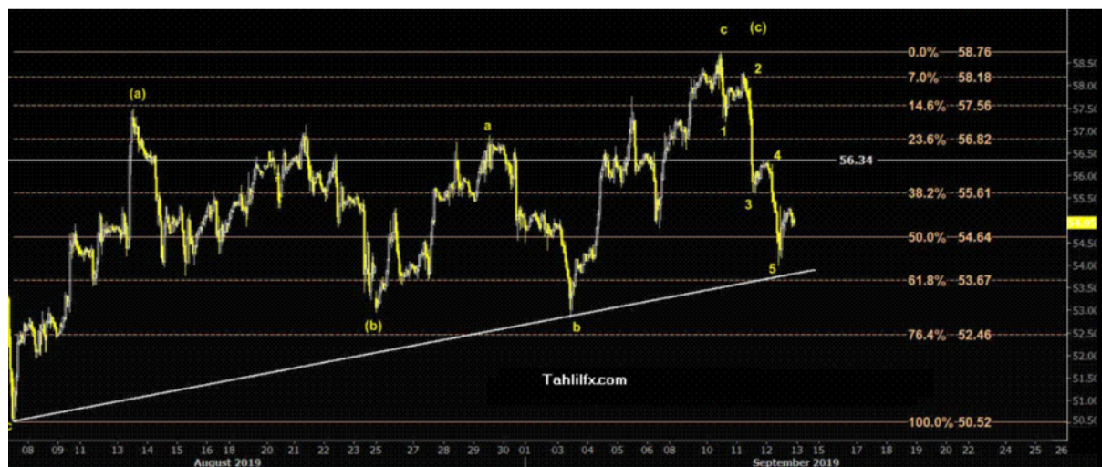
نمودار روند تغییرات تایم فریم روزانه قیمت نفت خام سبک آمریکا