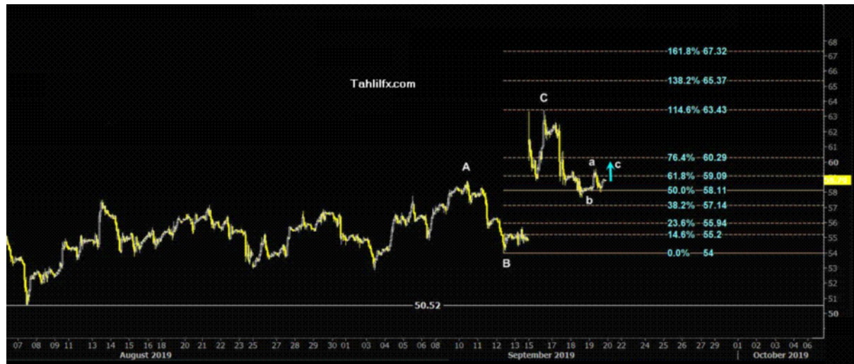
نمودار روند تغییرات تایم فریم روزانه قیمت نفت خام سبک آمریکا