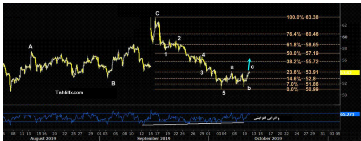
نمودار روند تغییرات تایم فریم روزانه قیمت نفت خام سبک آمریکا