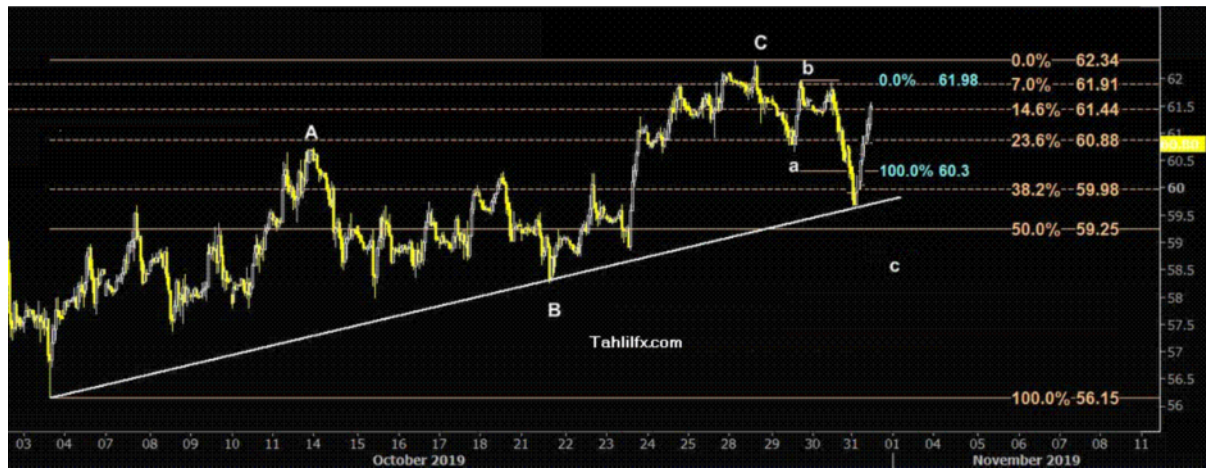
نمودار روند تغییرات تایم فریم روزانه قیمت نفت برنت دریای شمال لندن