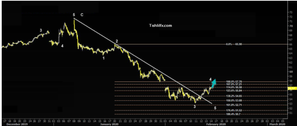
نمودار روند تغییرات تایم فریم روزانه قیمت نفت برنت دریای شمال لندن